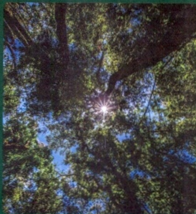
Reserva Biológica Municipal Dr. Moacyr Loures Pacheco e Erydan Bastos Pacheco